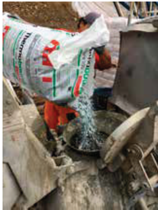
Thermobound 200 lt.