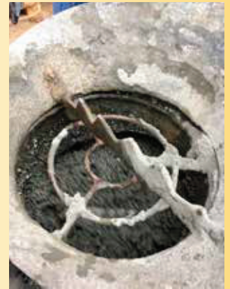
Mischzeit 2 - 3 Min.