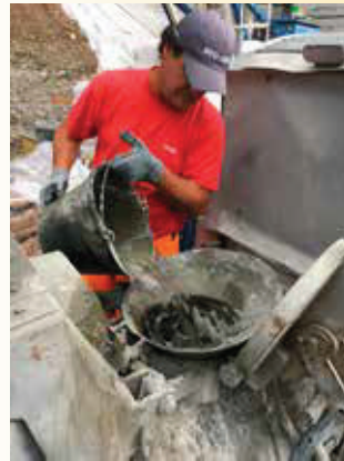
mit Wasser mischen